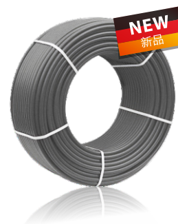
• 珠光灰 Pearl Grey